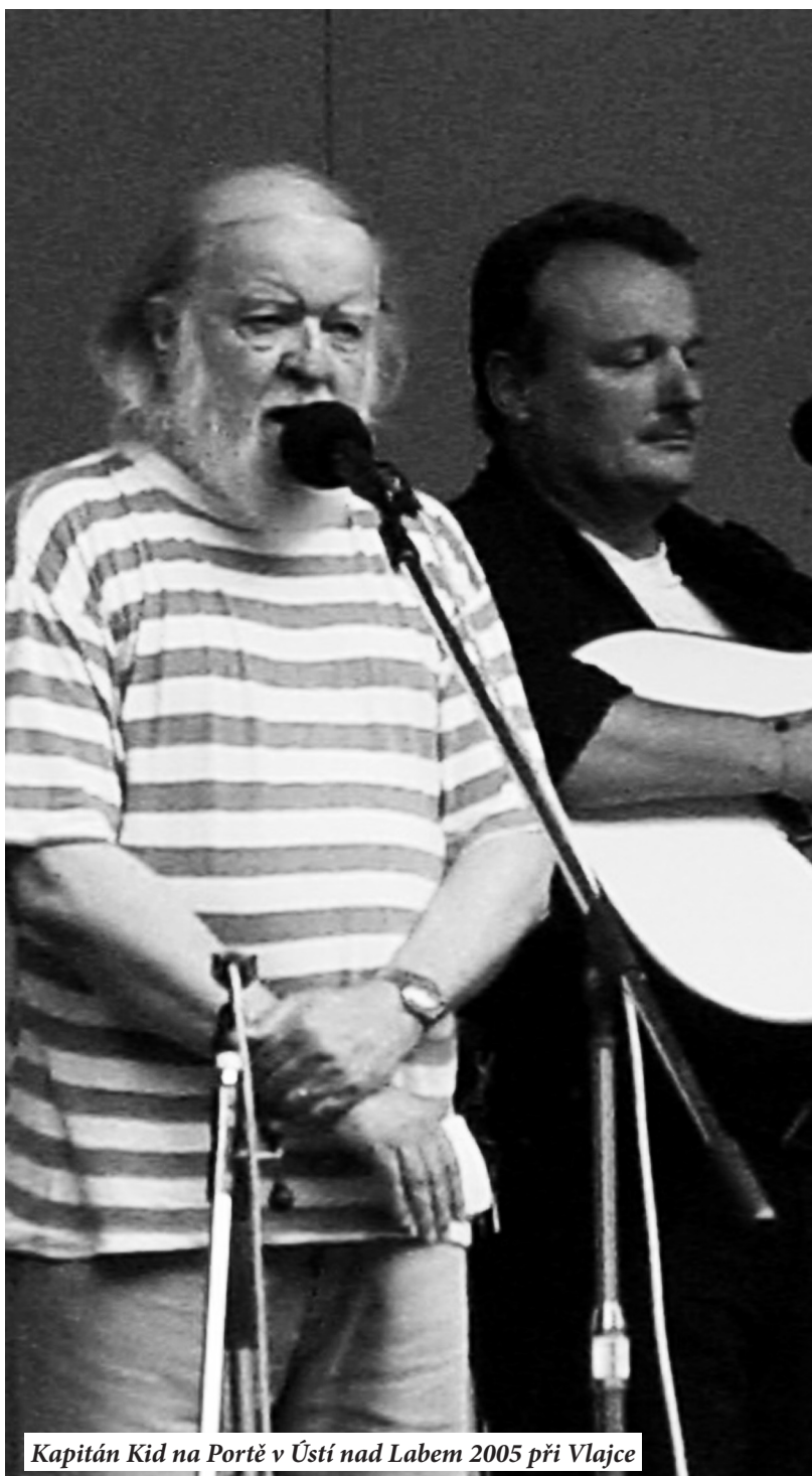
Kapitán Kid na Portě v Ústí nad Labem 2005 při Vlajce

ZPRAVODAJ FESTIVALU PORTA V ÚSTÍ NAD LABEM