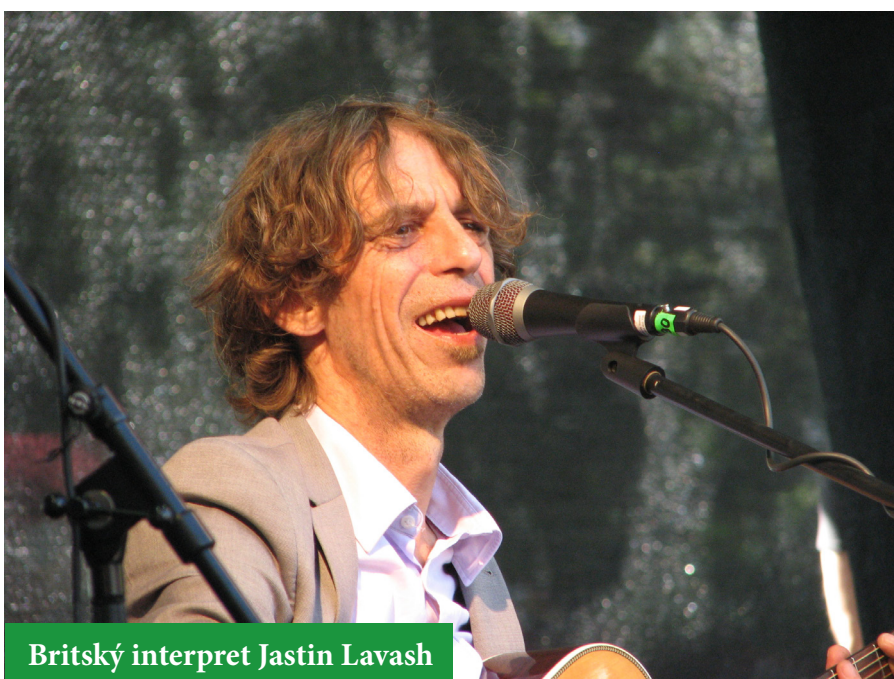
Britský interpret Justin Lavash

Kytara u nás k létu stále patří, i když při pohledu na mladé lidi v našich ulicích bychom mohli říct, že jsou to spíš sluchátka v uších. Tím spíš se však lidé - většinou o víkendech - sjíždějí na různé letní festivaly, kterých stále přibývá. Písničky zní všude, třebaže jsou různých žánrů i kvalit.